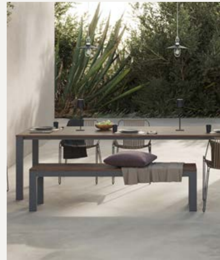
Tavolo e panca Ibiza

Sensazioni senza tempo per una nuova esperienza di convivialità. Incontri di forme morbide e rigorose geometrie, solidi spessori e linee leggere, in un mix che affascina per la sua stessa essenzialità. La sedia pieghevole, in alluminio e tessuto microforato, è un classico dell'outdoor interpretato alla luce di una raffinata funzionalità.