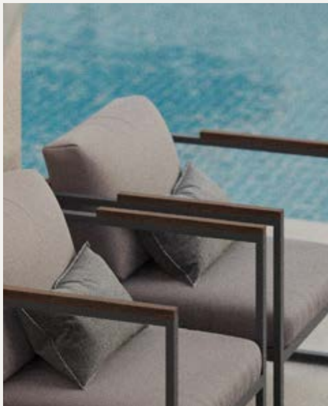
Sedia Ibiza Easy con legno Dettagli