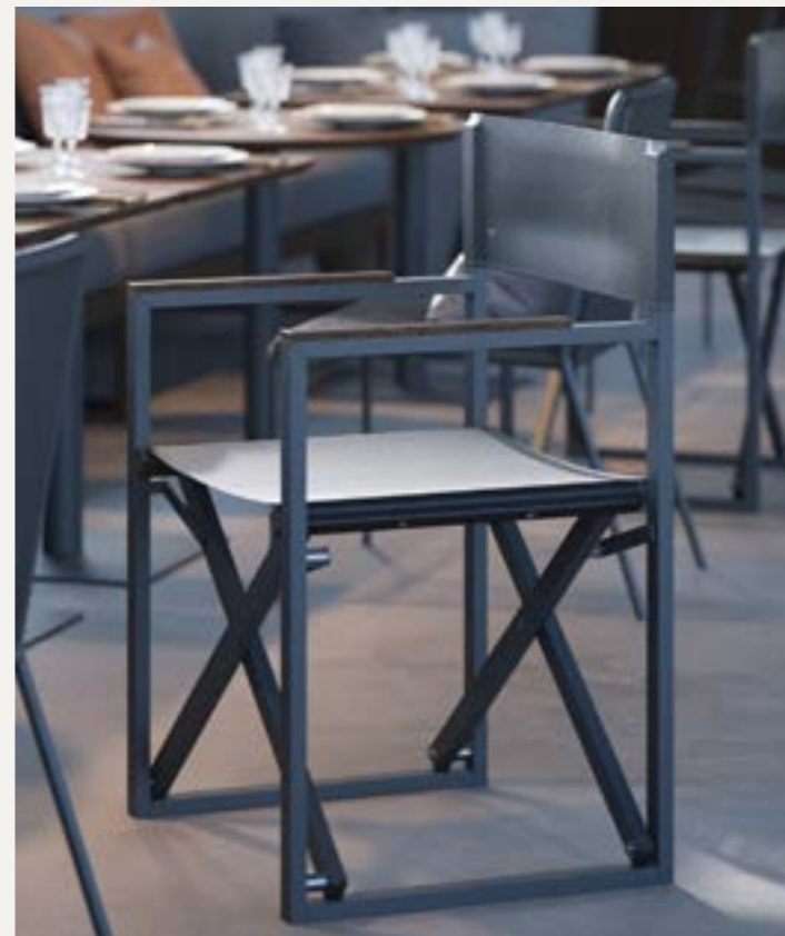
Sedia del direttore