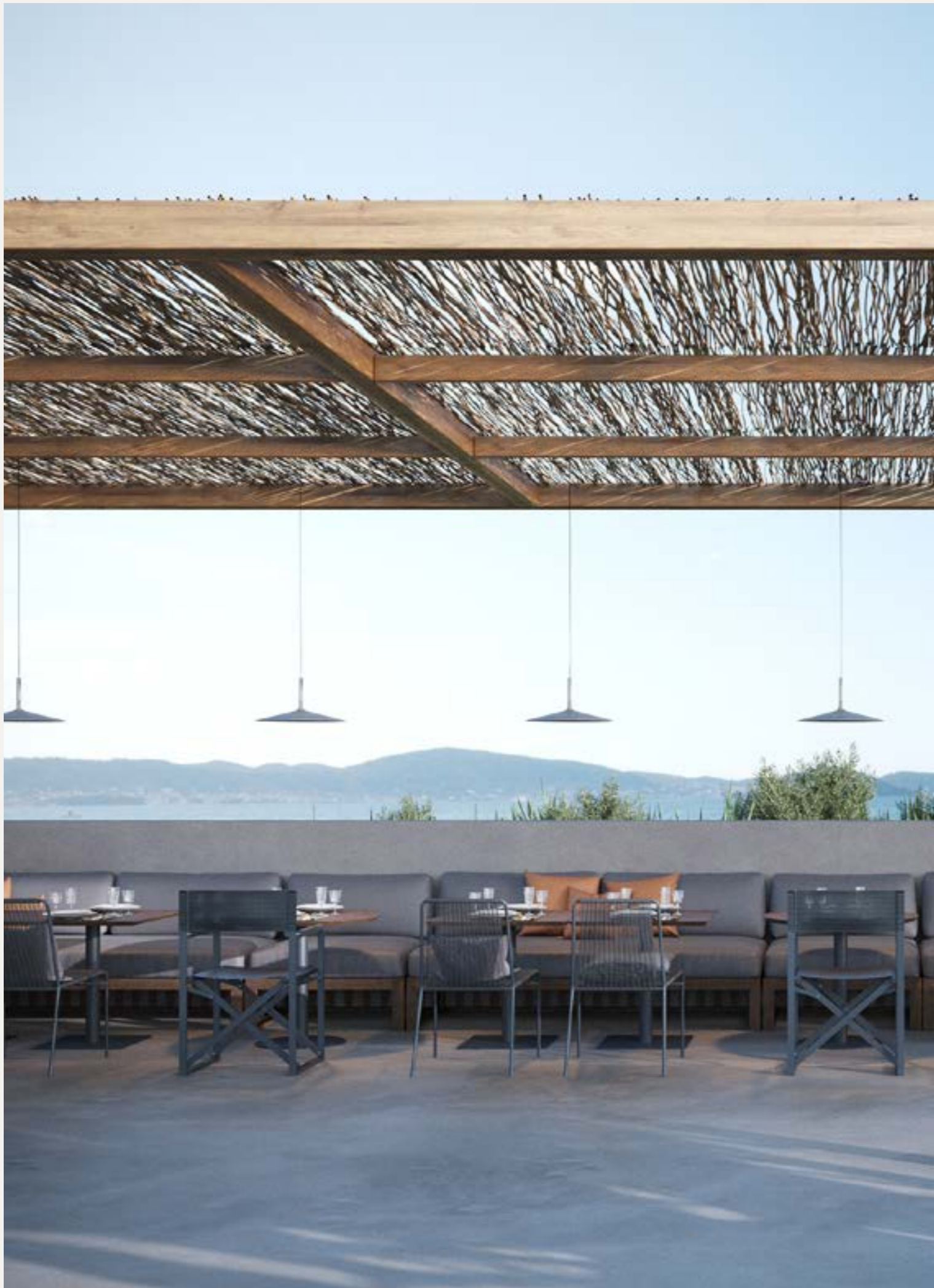
Un lounge bar fra il mare e il cielo, nel quale ogni elemento contribuisce a creare una sensazione unica, in perfetto equilibrio fra sofisticata contemporaneità e naturale immediatezza. Composizioni che seguono la linea dell'orizzonte, generando un senso di elegante relax. Situazioni che invitano alla socialità, sperimentando accostamenti anche inconsueti, sempre raffinati.