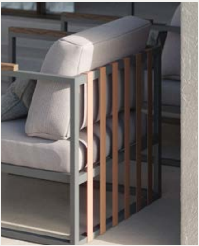
Dettagli delle cinghie di tessuto